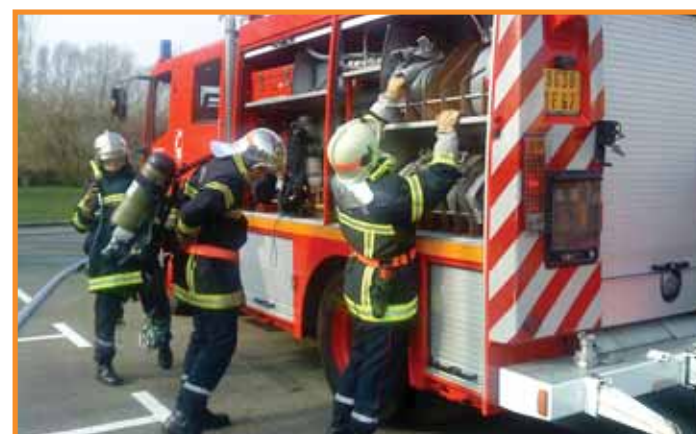
Les sapeurs-pompiers volontaires en manoeuvre.

Les SPV sont bien conscients qu'ils font partie d'une institution qui a un rôle à jouer dans la société. Cette dernière leur impose un haut niveau de compétence et de professionnalisme et les charge en même temps, symboliquement, d'une nouvelle responsabilité : responsabilité de se former, de par leur responsabilité-même vis-à-vis des victimes.