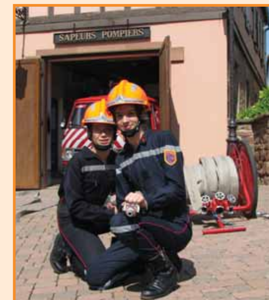
Informar la population est une nécessité afin de créer des vocations et susciter des engagements.

Avec le nombre de sections JSP présentes sur le territoire, de nombreux jeunes sapeurs ont pu fréquenter leurs rangs et constituent selon les dires de chacun de « bonnes recrues ».